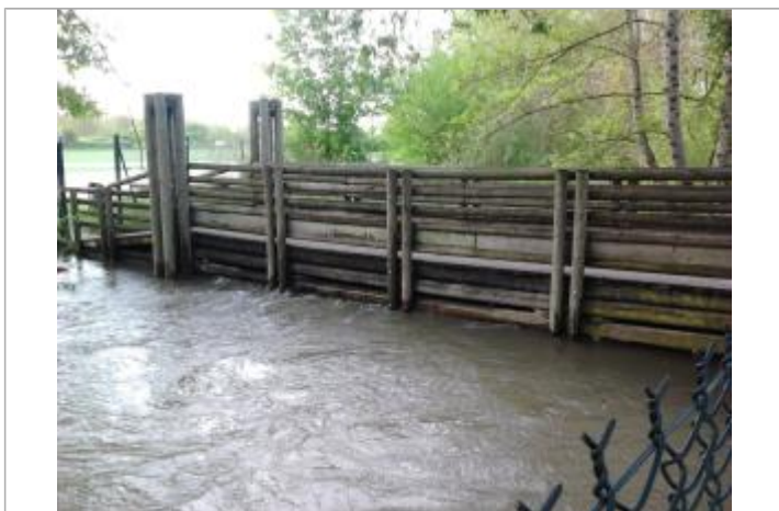
Niveau de débordement du Gourmerault le 05/05/2013 à 18h00