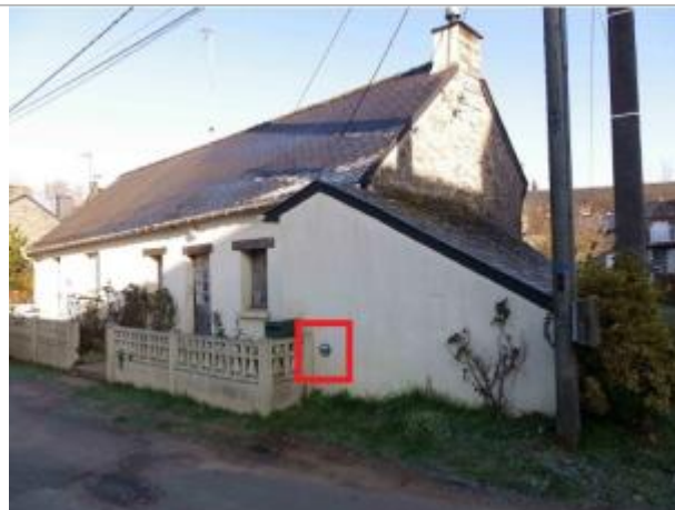
Maison au n°32 Rieux