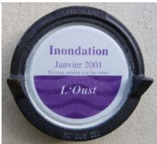
Repère normalisé de la crue de janvier 2001

Type de repérage : Campagne de terrain post-inondation