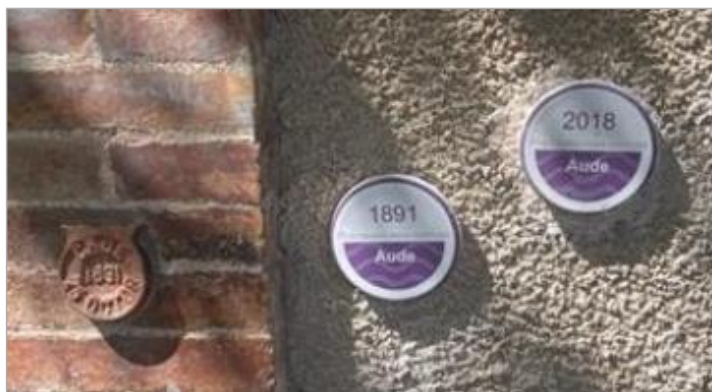
vue des repères