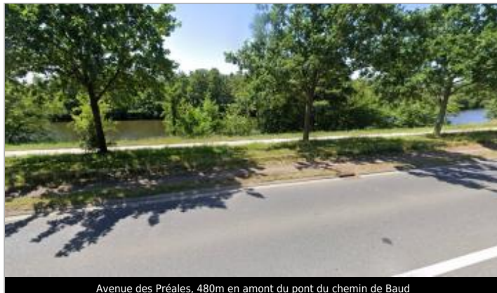
Avenue des Préales, 480m en amont du pont du chemin de Baud