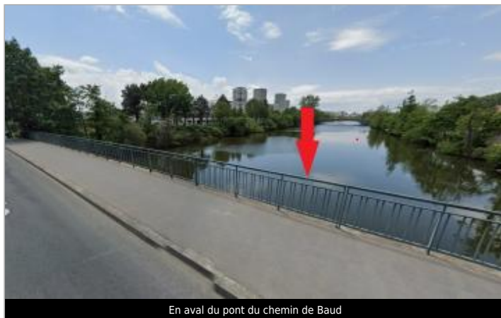
En aval du pont du chemin de Baud