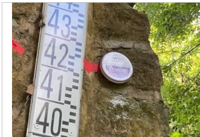
repere contre echelle