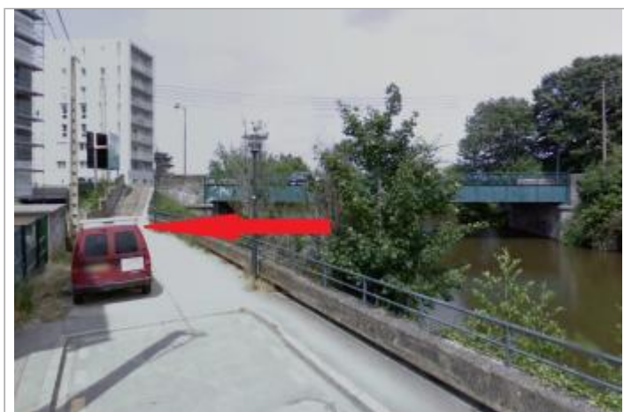
Chemin en aval rive droite du pont Villebois-Mareuil

GÉOLOCALISATION Coordonnées WGS84 : X: -1.65280556 / Y: 48.10818960 Coordonnées RGF93 (Lambert 93) X: 353904.46 / Y: 6788846.03 Coordonnées RGF93 (ETRS89) : X: -1.6528056 / Y: 48.1081896 Code Hydro: J---0060 Rive de référence: Droite