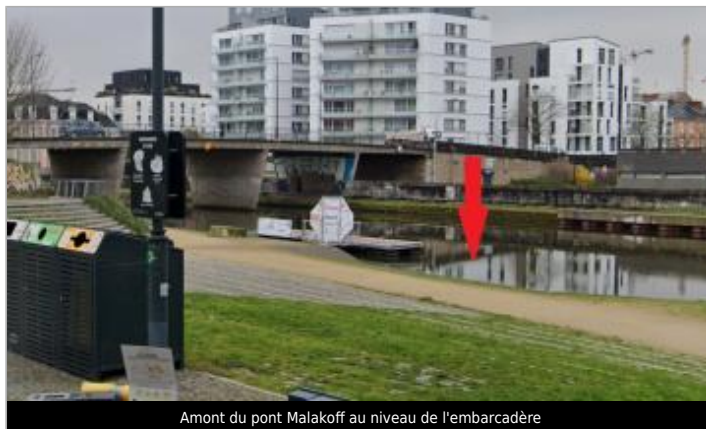
Amont du pont Malakoff au niveau de l'embarcadère