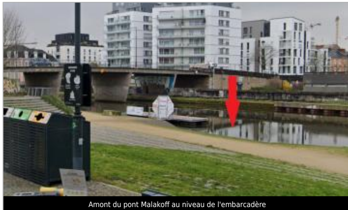
Amont du pont Malakoff au niveau de l'embarcadère