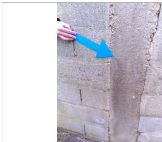
Vue de la laisse - Auteur : SPC LACI