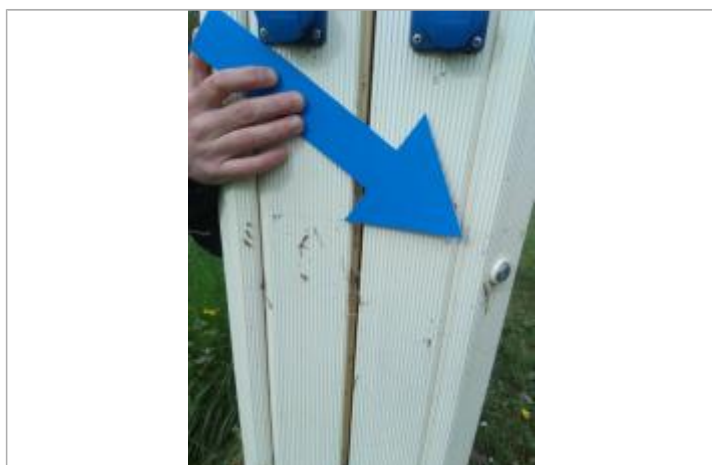
Vue de la laisse - Auteur : SPC LACI