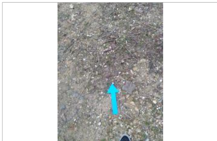
Vue de la laïsse

SOURCE DE REPÉRAGE : RELEVÉS DE LAISSES SUITE AUX CRUES SUR LE BASSIN DE LA VIENNE FIN MARS-DÉBUT AVRIL 2024 - 04/04/2024