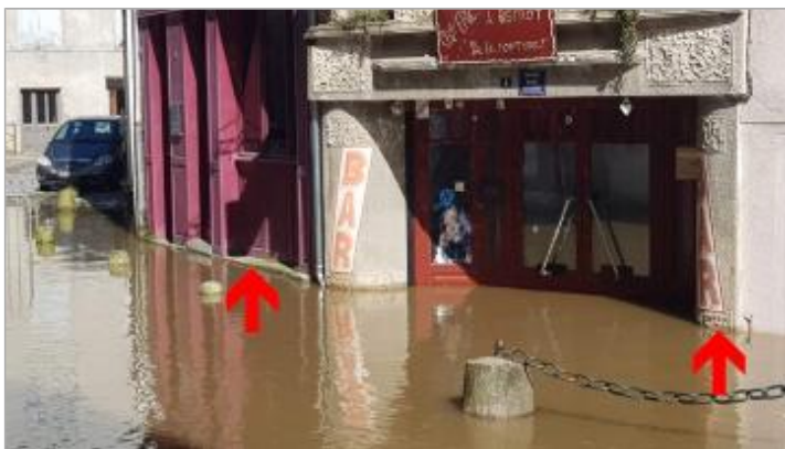
Vue de la laisse - Auteur : SIGIV