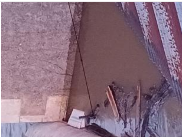
Vue de la laisse - Auteur : SMABCAC

Organisme : SPC Vienne - Charente - Atlantique