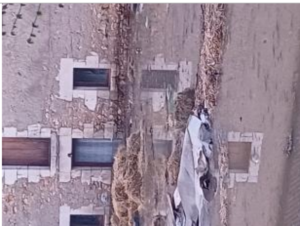
Vue de la laisse - Auteur : SMABCAC

Organisme : SPC Vienne - Charente - Atlantique