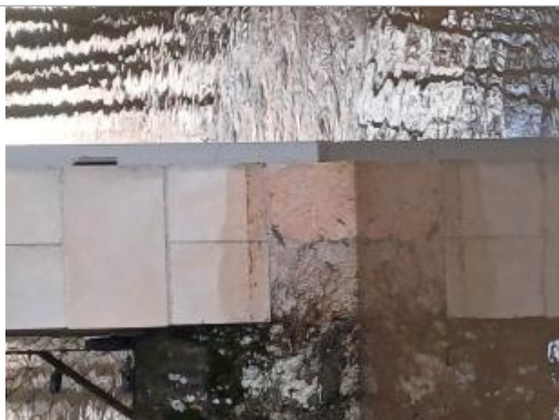
Vue de la laisse - Auteur : SMABCAC

Organisme : SPC Vienne - Charente - Atlantique