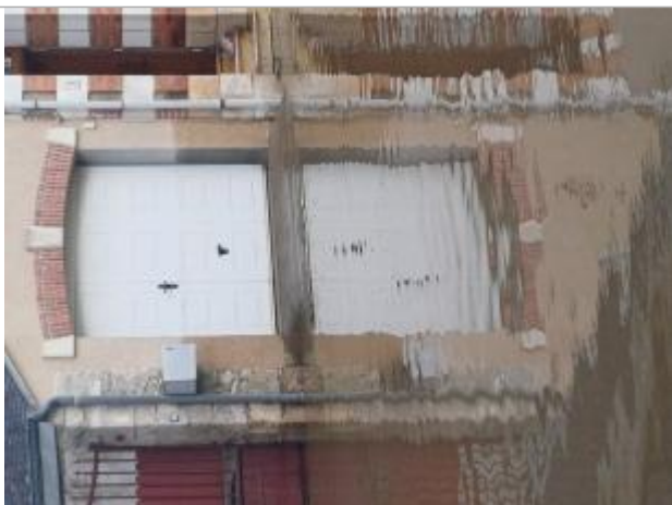
Vue de la laisse - Auteur : SMABCAC

Organisme : SPC Vienne - Charente - Atlantique