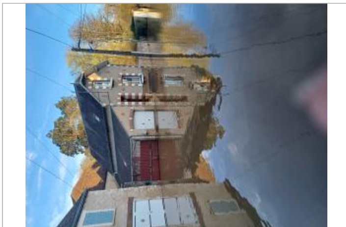
Vue du site - Auteur : SMABCAC