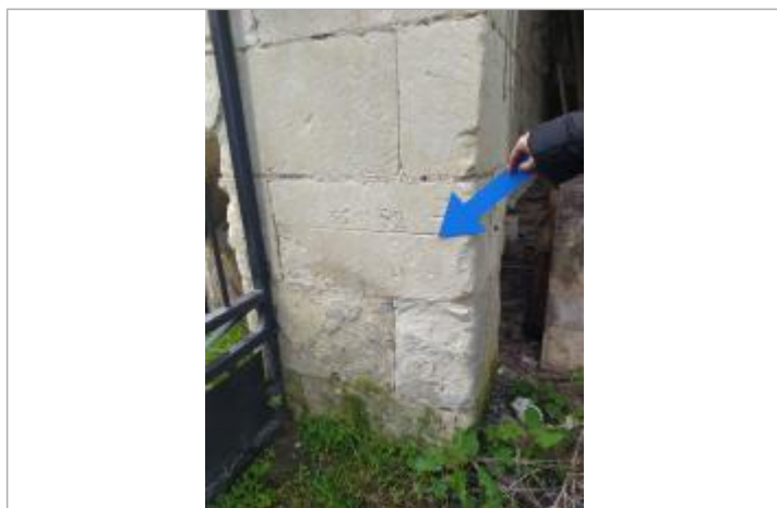
Vue de la laisse - Auteur : DDT 37

SOURCE DE REPÉRAGE : RELEVÉS DE LAISSES SUITE AUX CRUES SUR LE BASSIN DE LA VIENNE FIN MARS-DÉBUT AVRIL 2024 - 04/04/2024