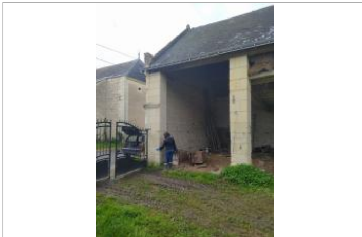
Vue du site - Auteur : DDT 37