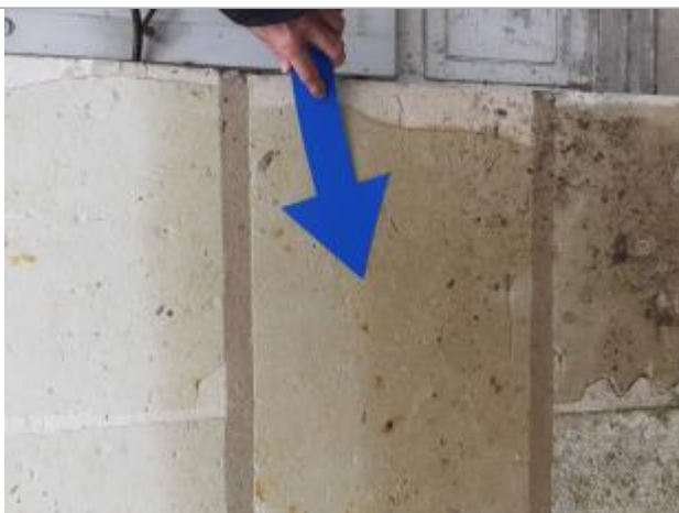
Vue de la laisse - Auteur : SPC MLA

Altitude calculée de l'eau (en m) : 34.82 m