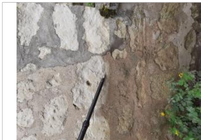
Vue de la laisse - Auteur : SPC MLA