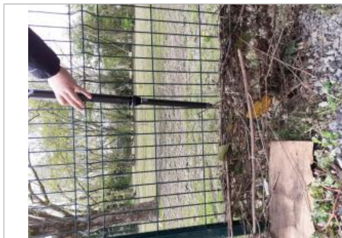
Vue de la laisse - Auteur : SPC MLA

Altitude calculée de l'eau (en m) : 35.3 m