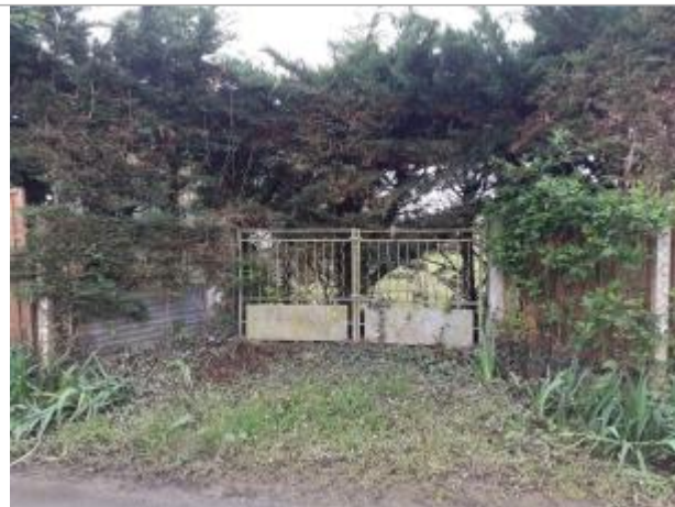
Vue du site - Auteur : SPC MLA