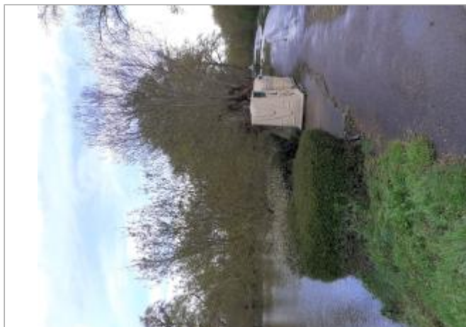
Vue du site - Auteur : SPC MLA

Coordonnées WGS84 : X: 0.12281100 / Y: 47.18036700