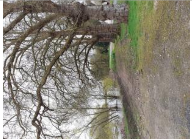
Vue du site - Auteur : SPC MLA

Coordonnées WGS84 : X: 0.10054980 / Y: 47.19366810