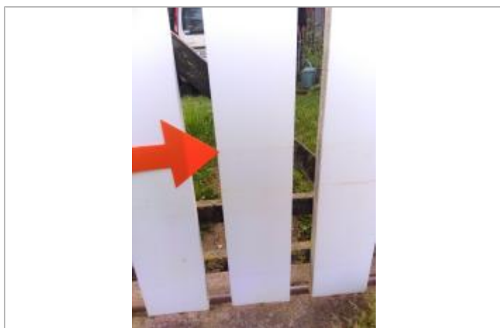
Vue de la laisse - Auteur : SPC LACI