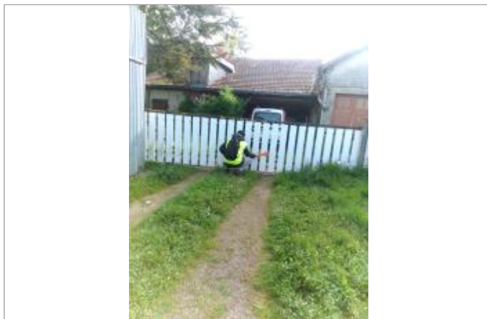
Vue du site - Auteur : SPC LACI

Coordonnées WGS84 : X: 0.54587400 / Y: 47.03575060