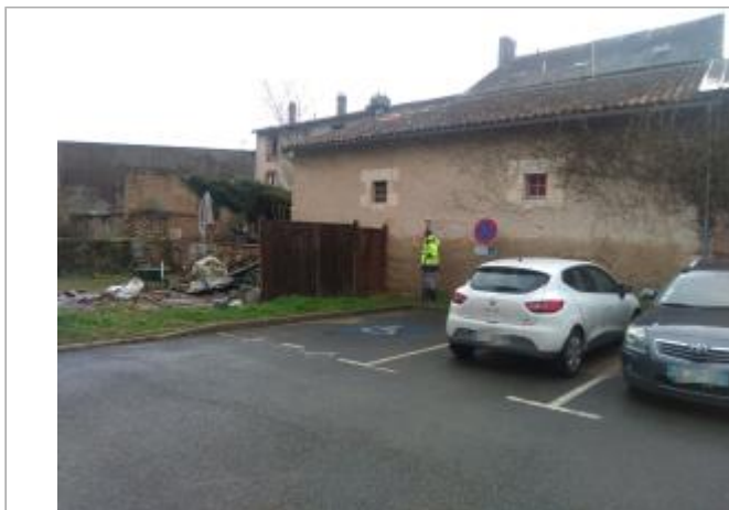
Vue du site - Auteur : SPC LACI

Coordonnées WGS84 : X: 0.86926450 / Y: 46.42829950