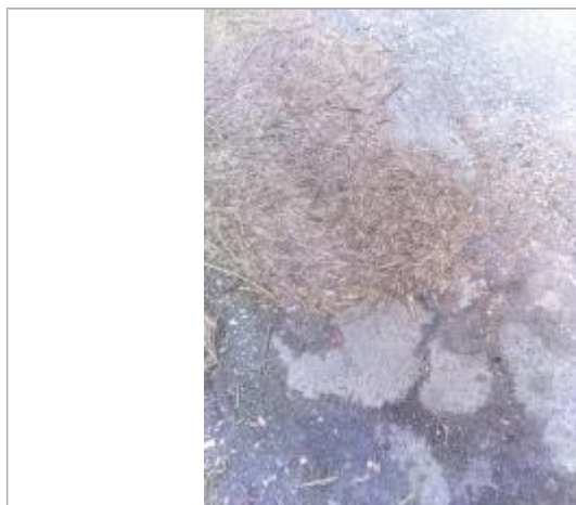
Vue de la laisse - Auteur : SPC LACI