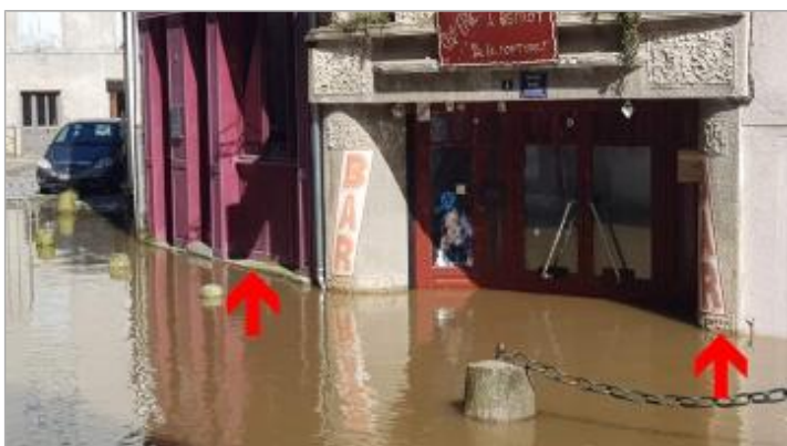
Vue de la laisse - Auteur : SIGIV

Maximum de l'inondation : Oui Visibilité : Non État du repère : Non renseigné Pérennité : Aucune Repère calculé : Non renseigné PHEC : Non renseigné