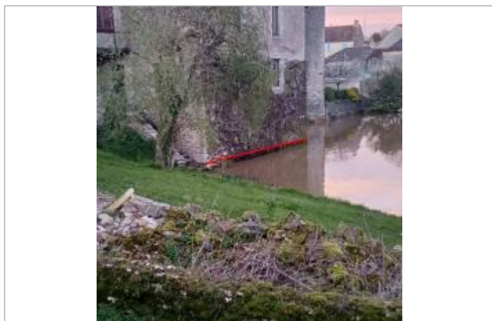
Vue de la laisse - Auteur : SMABCAC

Maximum de l'inondation : Oui Visibilité : Non État du repère : Non renseigné Pérennité : Aucune Repère calculé : Non renseigné PHEC : Non renseigné