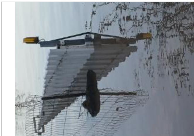
Vue de la laisse - Auteur : SMABCAC

Organisme(s) : SPC Vienne - Charente - Atlantique