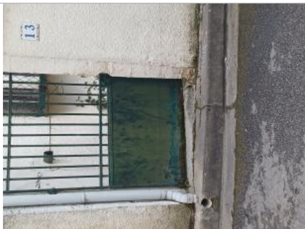
Vue de la laisse - Auteur : SMABCAC

Organisme : SPC Vienne - Charente - Atlantique