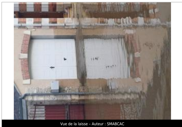
Vue de la laisse - Auteur : SMABCAC

SOURCE DE REPÉRAGE : RELEVÉS DE LAISSES SUITE AUX CRUES SUR LE BASSIN DE LA VIENNE FIN MARS-DÉBUT AVRIL 2024 - 04/04/2024