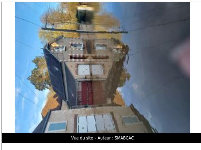
Vue du site - Auteur : SMABCAC