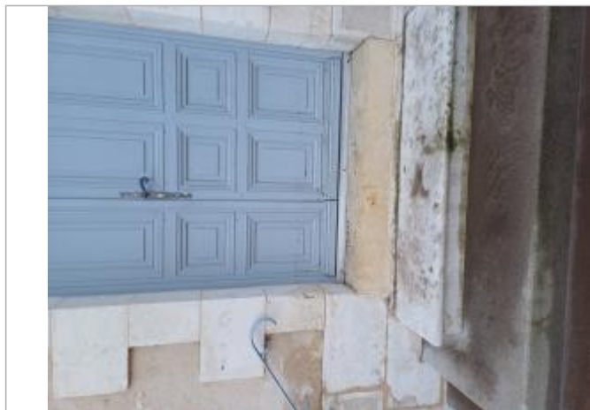
Vue de la laisse - Auteur : SMABCAC

SOURCE DE REPÉRAGE : RELEVÉS DE LAISSES SUITE AUX CRUES SUR LE BASSIN DE LA VIENNE FIN MARS-DÉBUT AVRIL 2024 - 04/04/2024