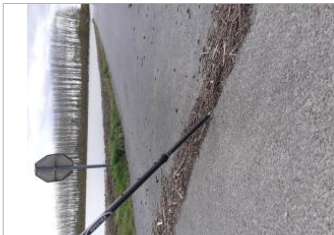
Vue du site - Auteur : SPC MLA

Coordonnées WGS84 : X: 0.26911040 / Y: 47.16521600