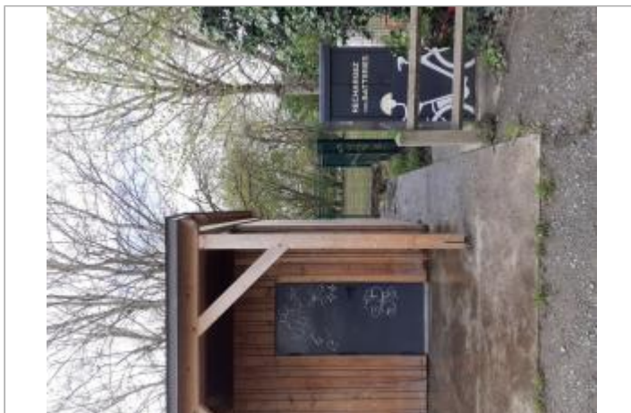
Vue du site - Auteur : SPC MLA