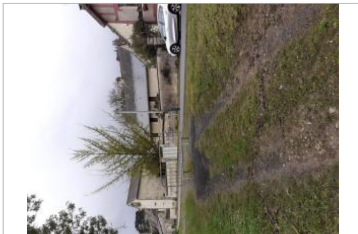
Vue du site - Auteur : SPC MLA