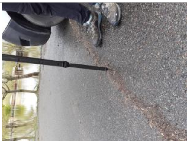
Vue de la laisse - Auteur : SPC MLA