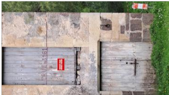
Trait à mi-porte du 1er niveau