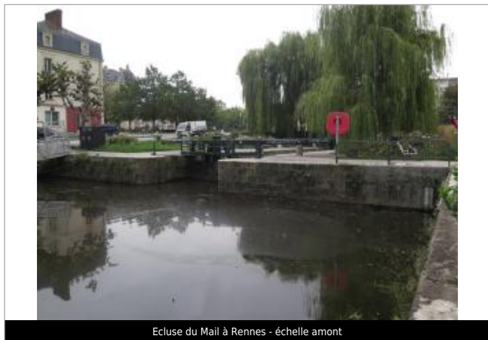
Ecluse du Mail à Rennes - échelle amont

Altitude calculée de l'eau (en m) : 25.15 m