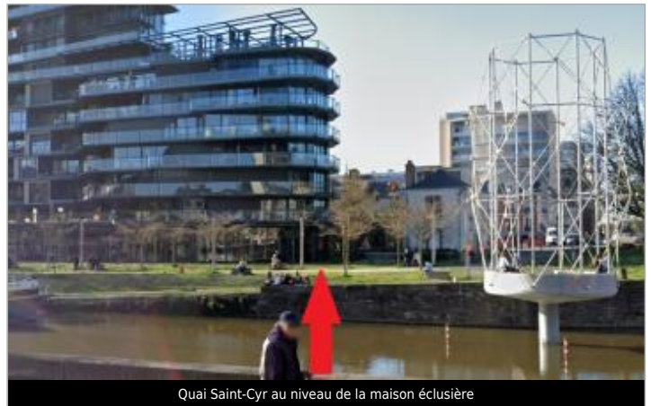
Quai Saint-Cyr au niveau de la maison éclusière

Coordonnées WGS84 : X: -1.68605179 / Y: 48.10966470