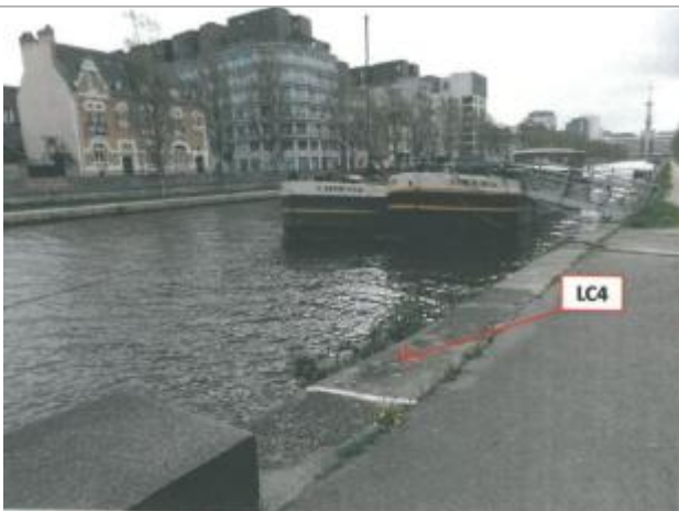
Quai Saint-Cyr au niveau de la maison éclusière

Altitude calculée de l'eau (en m) : 24.54