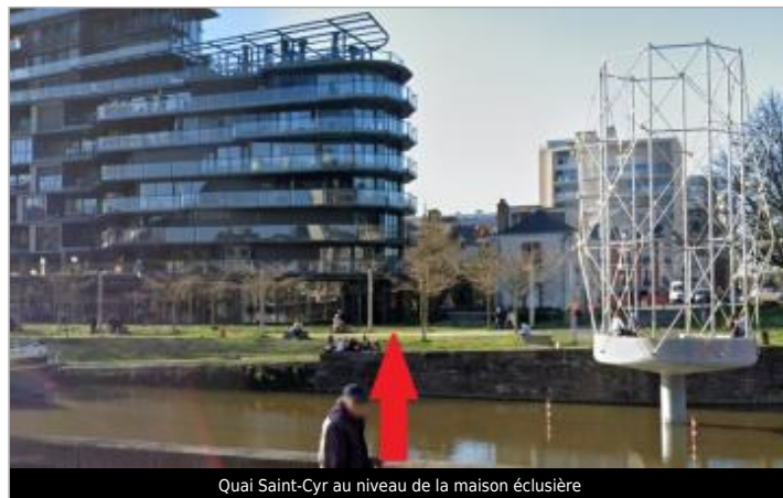
Quai Saint-Cyr au niveau de la maison éclusière

Coordonnées WGS84 : X: -1.68605179 / Y: 48.10966470