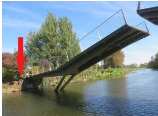
Promenade des bonnets rouges au niveau de la passerelle