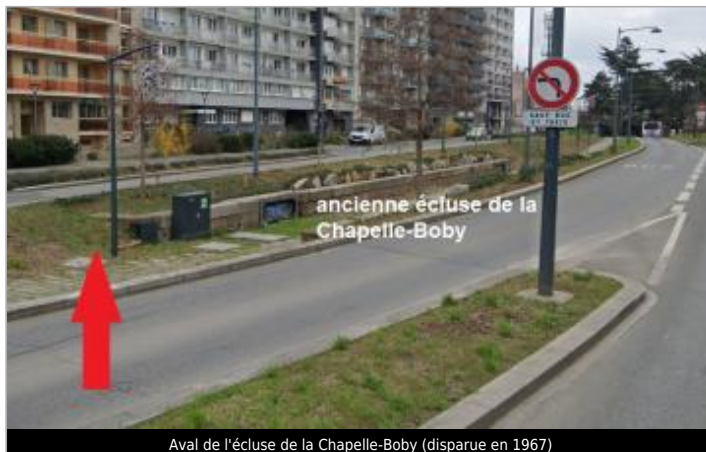
Aval de l'écluse de la Chapelle-Boby (disparue en 1967)