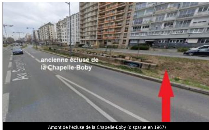
Amont de l'écluse de la Chapelle-Boby (disparue en 1967)