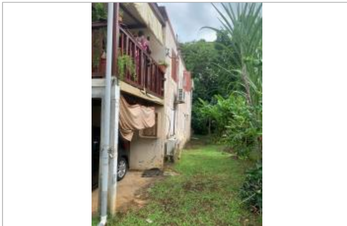
Vue entre la maison et la ravine