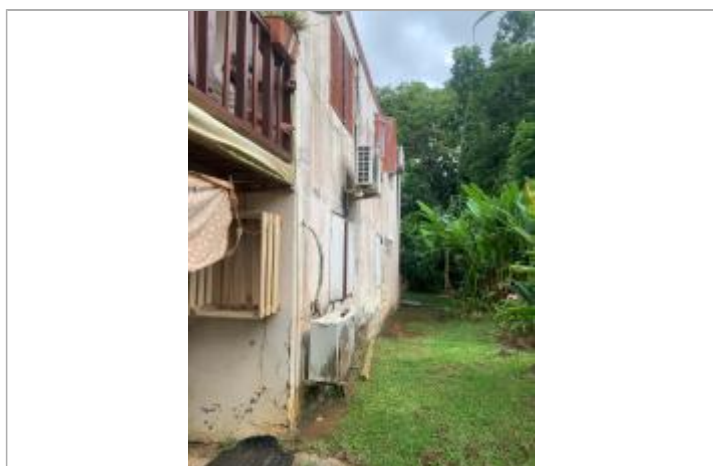
PHE depuis le socle de la maison