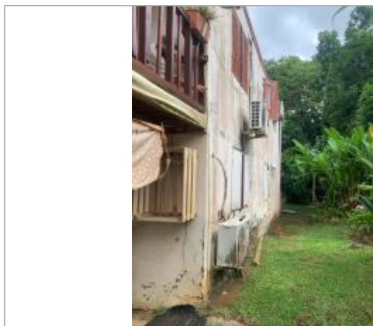
PHE depuis le socle de la maison