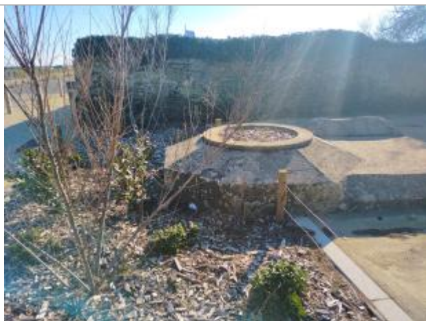
Photo du repère de submersion