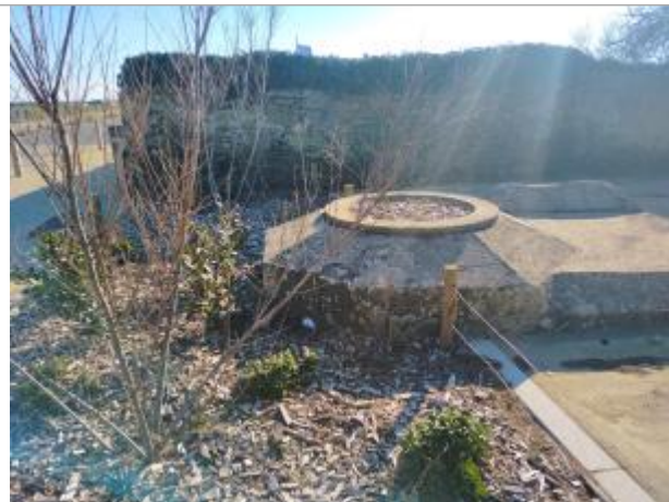
Penvins à Sarzeau