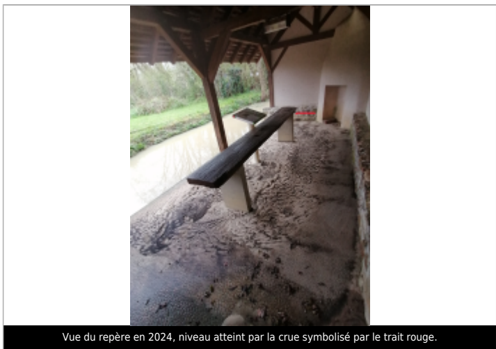
Vue du repère en 2024, niveau atteint par la crue symbolisé par le trait rouge.

GÉNÉRAL Code : WEB_R_202405144005 Date de mise à jour : 14/05/2024 Auteur : SPC LACI