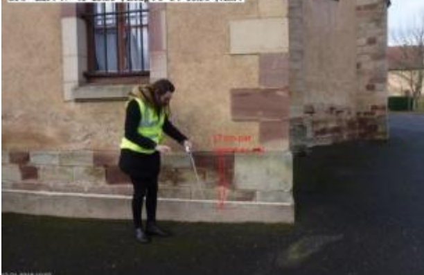
Point 76 = arrière de l'église

08, Date/heure photo : 2018-01-11_14:55:49 La Côte - Rue de la Mairie Crue de janvier 2018 GPS - Lat : 47° 41' 23.35", Long : 6° 34' 16.36", Alt : 314.631 m