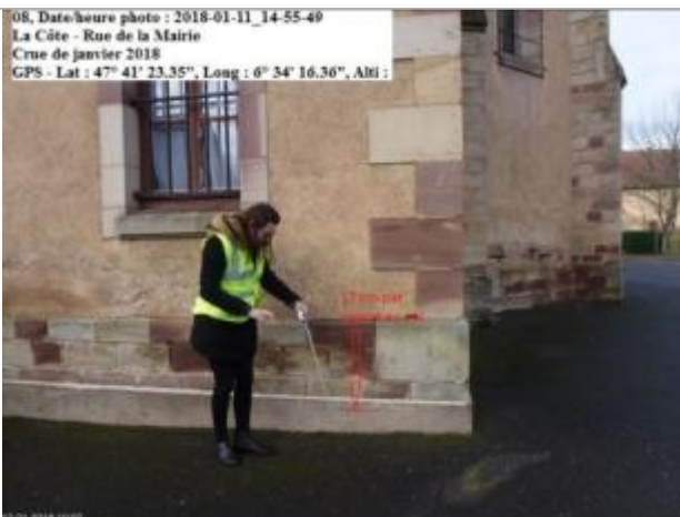
Point 76 = arrière de l'église

08, Date/heure photo : 2018-01-11_14-55-49 La Côte - Rue de la Mairie Crue de janvier 2018 GPS - Lat : 47° 41' 23.35", Long : 6° 54' 16.36", Abi :