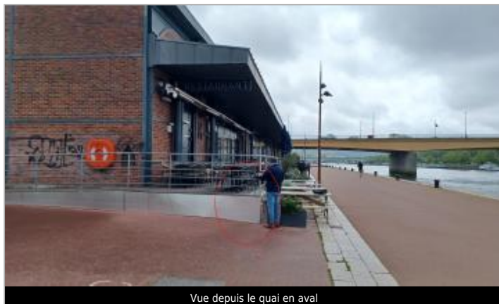
Vue depuis le quai en aval