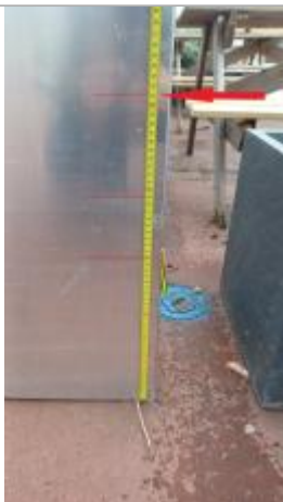
Laisse de crue à 51 cm/sol.

Altitude calculée de l'eau (en m) : 5.41 m