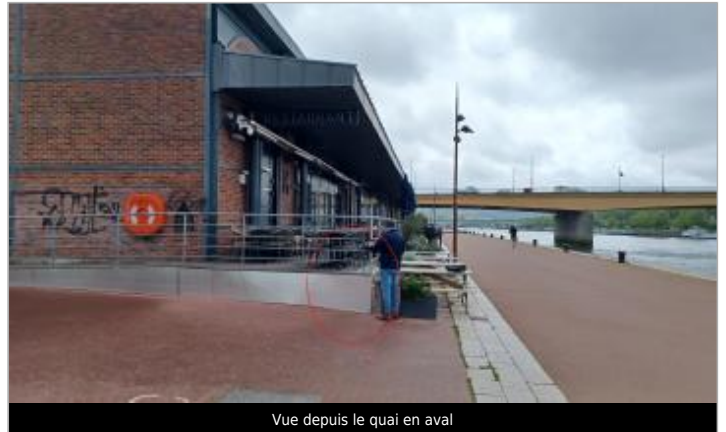
Vue depuis le quai en aval

Coordonnées WGS84 : X: 1.07981247 / Y: 49.44113660