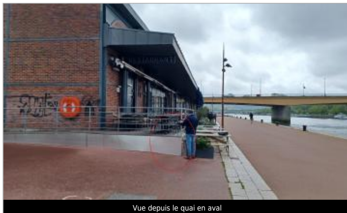
Vue depuis le quai en aval