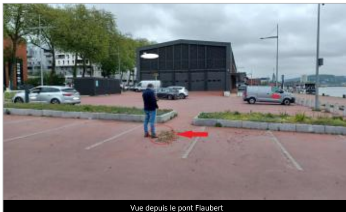
Vue depuis le pont Flaubert